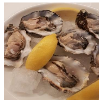
Verse oesters per dozijn, Umami of Gillardeau.

BESTELLEN graag uiterlijk 13 december bij Jitske via email jjitman@gmail.com of whatsapp 06-24 60 22 96