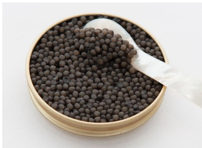
Keluga Amour, romig met nootachtige tonen.