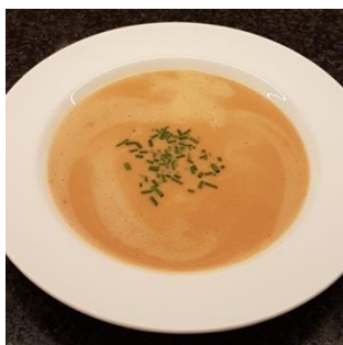
Heerlijke bisque van sterchef Marcel van der Kleijn.

De zalmproducten worden vers gevacumeerd en gekoeld geleverd. In de ijskast 3 weken houdbaar, tenminste 6 maanden in de vriezer. *indicatief, eindprijs op basis van reële gewicht