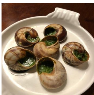
Bourgondische slakjes, zo uit de oven.